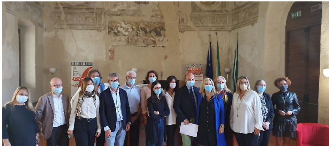
Foto di gruppo per la presentazione di Mondì di Carta 2020

Sono i temi principali del festival al via il 3 ottobre. Dal museo civico si passa agli spazi del teatro San Domenico, necessità legata ai numeri contingentati di spettatori per le diverse iniziative