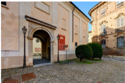
Il Viaggiatore Magazine – Museo Civico Cremasco – Crema, Cremona