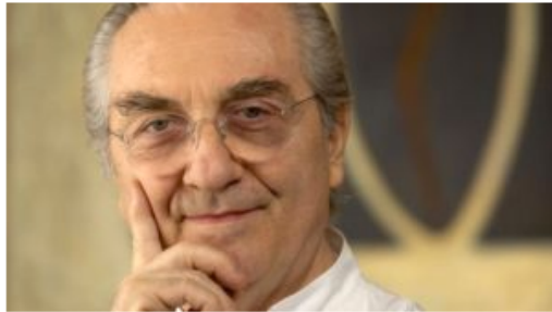
Il Viaggiatore Magazine – Gualtiero Marchesi